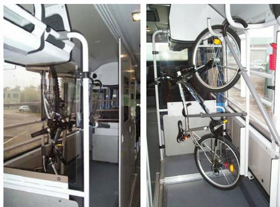
Illustration 13 : vue du local vélos.. Sources : CG de Saône et Loire